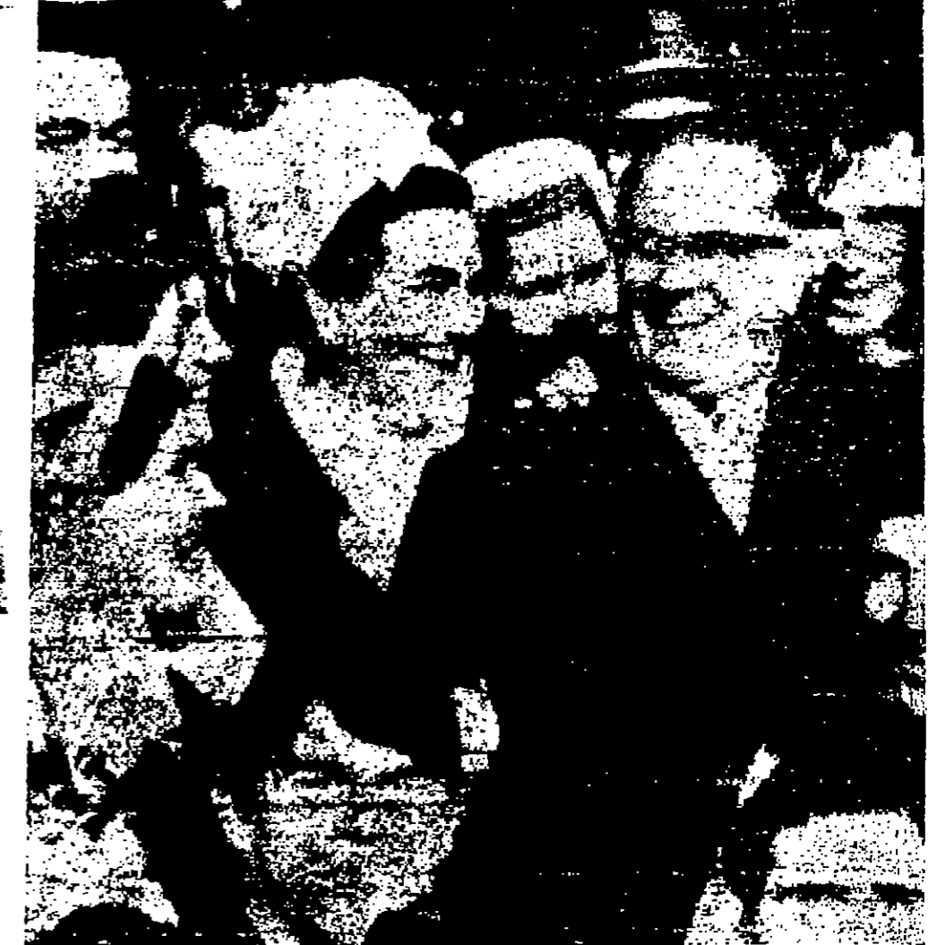
شبان مقلدة البوسنة في يوغوسلافيا يهتفون بالفرنسيين خلال زيارته لجنيف...